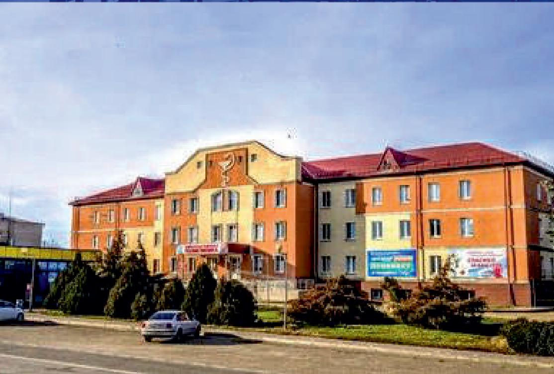
МБУЗ ЦЕНТРАЛЬНАЯ РАЙОННАЯ БОЛЬНИЦА