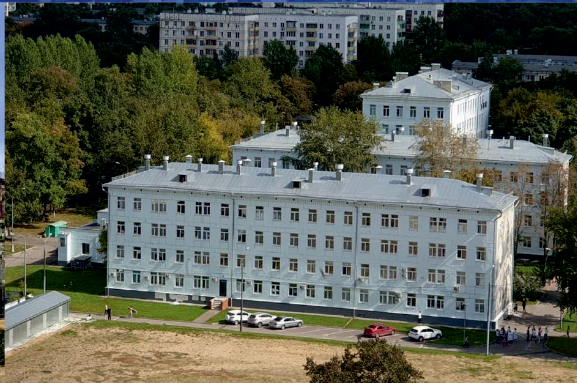
АКАДЕМИЯ СЛЕДСТВЕННОГО КОМИТЕТА РОССИЙСКОЙ ФЕДЕРАЦИИ