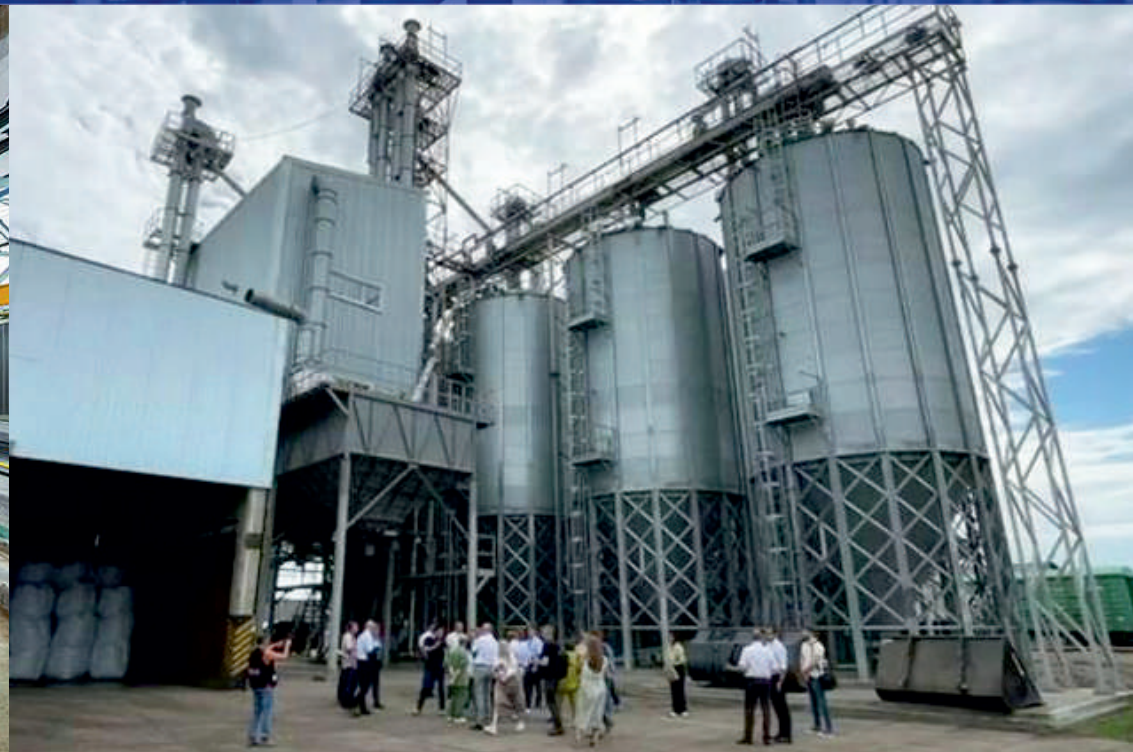
ЦЕХ ПО ПЕРЕРАБОТКЕ МАСЛИЧНЫХ КУЛЬТУР 200 Т/СУТ